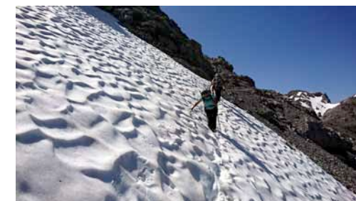
Weg zur Bitterscharte

Es war eine Tour mit vielen geänderten Wegen, aber dafür auch mit vielen schönen Naturerlebnissen und Tierbegegnungen. Die Regenjacke war das einzige ungenutzte Gepäckstück in unseren Rucksäcken, bleibt aber auch bei der nächsten Wanderung wieder drin. Uli Hoeding