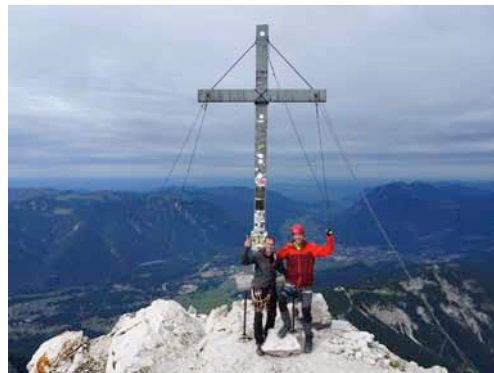
Der Alpspitzgipfel als Belohnung

beim Klettern auch. Oft ging es buchstäblich wie auf des Messers Schneide (was die Wegfindung natürlich extrem vereinfacht...), manchmal waren Grattürme zu erklettern oder zu umgehen, fast immer ging es zu mindes-