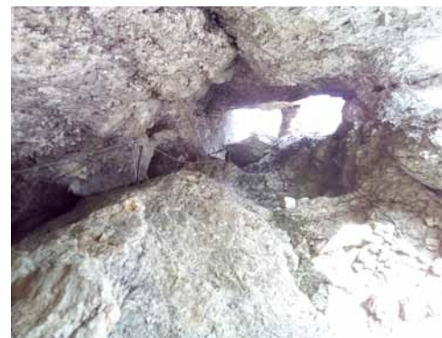
Hoch durch den Stopselzieher

Der „Jubi“: Ein Traum! Schon lange hatte ich von der Zugspitze zur Alpsspitze „obenrum“ gehen wollen, nie hatte es geklappt: Wegen Wetter, Terminen, kaputten Schuhen... Aber dieses Jahr sollte es unbedingt sein. Leider konnten wir dank Stau erst nach 15 Uhr in die Zugspitzbahn steigen, die uns die ersten 900 Höhenmeter bis zum „Riffelriss“ (1639m) abnahm. Hier beginnt die ziemlich teure Fahrt durch den Tunnel zum Zugspitzplatt, aber wir wollten uns lieber für morgen einlaufen. Leider ließ uns der Weg oberhalb des Eibsees erstmal Höhenmeter verlieren und im Aufstieg schwitzten wir dann trotz vorgerückter Stunde nochmal ganz schön. Immerhin unterboten wir die angegebene Gehzeit von 3 Stunden zur Wiener Neustädter Hütte (2213m) deutlich. Wir überlegten, statt auf dem Münchner Haus vielleicht doch schon hier in der sicher schöneren Unterkunft zu übernachten, hätten dann aber morgen vor der „Gratwanderung“ noch fast 800m Aufstieg zu meistern gehabt. Der Hüttenwirt machte die erbetene Beratung hierzu sehr kurz: „Ich hab eh keine Lager mehr frei – und wenn ihr in 1:45 Stunden hier wart, schafft ihr es auch noch in 2 Stunden zum Gipfel“; er sollte Recht behalten.