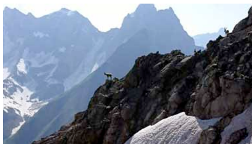
Steinböcke am Oberlahmsjoch

nenschein, die 2 Teilnehmer stiegen ab nach Zams. Zu dritt setzten wir unsere Tour nun fort. Wieder mit einem nicht unerheblichen Umweg über 2 Scharten, da der direkte Weg noch zu verschneit war. Das Leiterjöchel hatte zwar keine Leitern, wie der Name vermuten ließ, aber im Abstieg fehlten noch Teile des Weges, die das Tauwetter bereits weggerissen hatte. So mussten wir einem Schneerest über den darüber liegenden Felsen ausweichen. Danach ging es über stark abschüssiges Geröll zurück zum schmalen Pfad. Vor dem Ober-