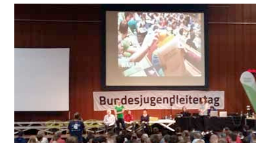
Blick Aula - Bundesjugendleitertag

Stichwort Wahlen: Und so geht es gleich auf der Bundesebene weiter! Auf dem Landesjugendleitertreffen sprachen wir auch über den anstehenden Bundesjugendleitertag und verabredeten uns teilweise in Fahrgemeinschaft dorthin zu fahren, um nicht nur unsere kleinen Sektionen sondern auch den Landesverband dort sichtbar zu vertreten-